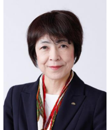
CPO（集團人力資源總監）